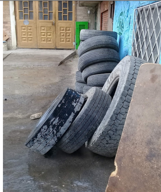
Foto 2. Vista general del acopio de llantas