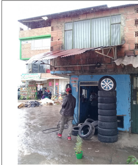
Foto 1. Vista general del establecimiento